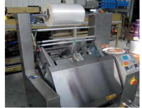
Paslanmaz Çelik Gövde opsiyonu