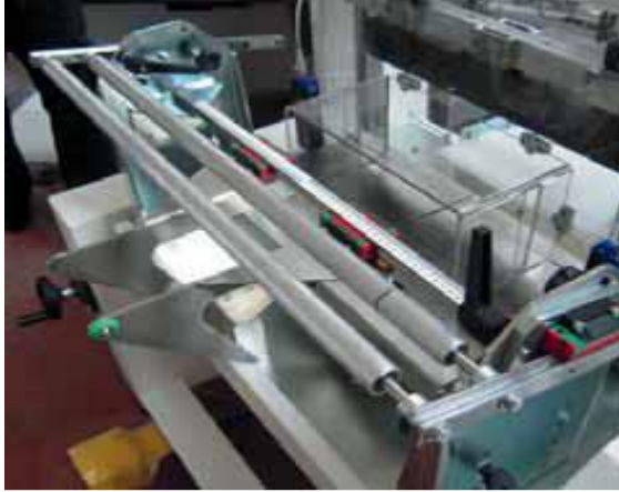
Farklı ürün ve ebatlar için uygundur

Ayarlanabilir yaka yapısı ile farklı ebatlarda paketler ve ürünlerle çalışma imkanı sağlar. 700 mm' ye kadar geniş film ile çalışabilir. Polipropilen, polyolefin, perfore gibi farklı film tipleriyle çalışabilir. ISO sertifikalı parçalar kullanılmaktadır, bu özellik sizlere, yedke parça ihtiyacı durumunda, parçaları piyasadan kolaylıkla bulabilme ve tedarik edebilmeyi sağlamaktadır. Makinede ürüne değen kısımlar, Paslanmaz Çeliktir. Siemens kontrol paneli üzerinden kontrol ve işletimi sağlanır.